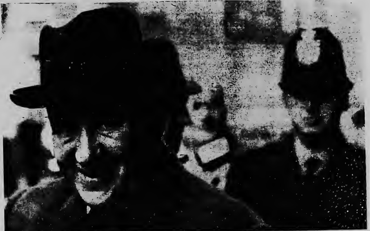
Despues di un bishita di un siman na Gran Bretaña, e promer minister Sovietico Alexei Kosygin ayera a regresa Moscu. Aunque cu e promer minister sovietico y su colega Britanico a falla di yega na un acuerdo cu otro, "nan lo hasi tur esfuerso posibel" pa percura un paz duradero na Vietnam.